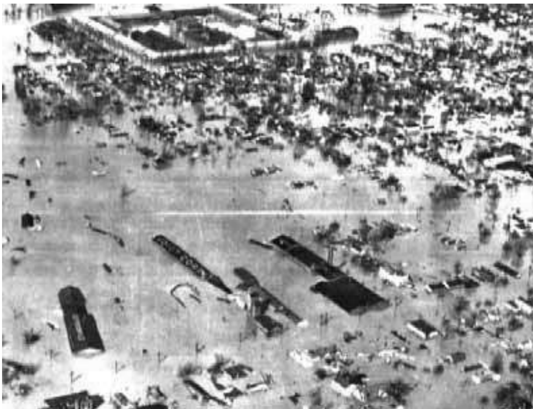
Une vue aérienne de l'inondation à Jeffersonville