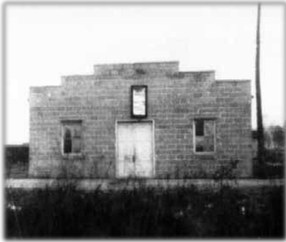
Le Branham Tabernacle, au coin de la 8 e et de la rue Penn à Jeffersonville, Indiana (1930)