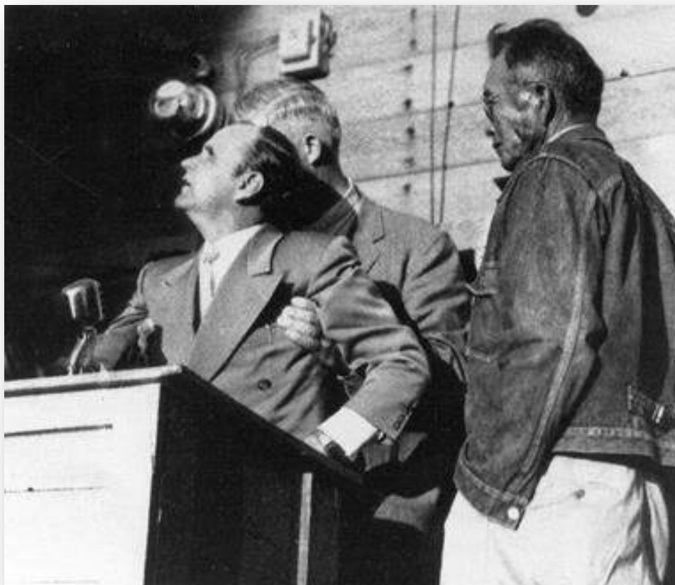
William Branham chancelant sous l'onction alors qu'il exerce son ministère à la réserve indienne de San Carlos

En réponse, les gens se jetèrent en une ligne de prière pour attendre leur tour. Par l'intermédiaire d'un interprète, Bill pria pour les malades et les nécessiteux durant dix heures de plus. Ces gens de langue espagnole croyaient en Jésus-Christ d'une foi si pure que plusieurs miracles se produisirent ce soir-là. Parmi les centaines de miracles qui eurent lieu ce soir-là, les trois Indiens apaches amenés par le missionnaire furent guéris.