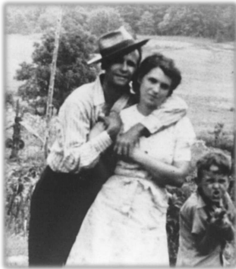
Bill, Meda et Billy Paul Branham