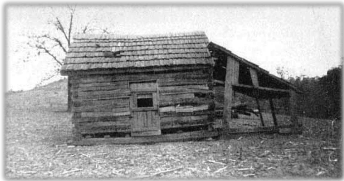
La cabane de bois rond près de Burkesville, Kentucky, où William Branham est né le 6 avril 1909