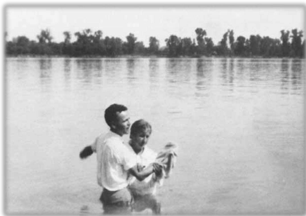
Bill baptisant dans la rivière Ohio

Bill éleva la voix pour se faire entendre de la foule sur le rivage : « Inclinez vos têtes. » Lorsqu'ils le firent, Bill pencha la tête et commença à prier à haute voix : « Père Céleste - »